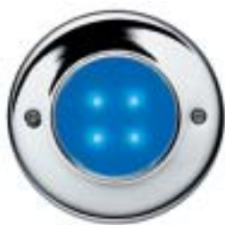
AQUALED® 4-BC SW/SIL azul cromado