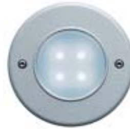
AQUALED® 4-WG SW/ALU blanco granito