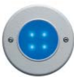
AQUALED® 4-BG SW/ALU azul granito