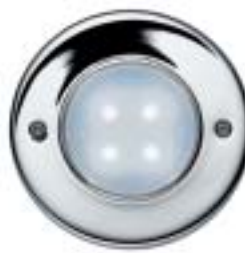
AQUALED® 4-WC SW/SIL blanco cromado